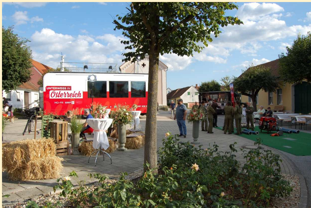
ORF-Live-Sendungen am 4. und 5. September 2017 „Daheim in Österreich“ und „Guten Morgen Österreich“

Gemeinderundschreiben für Rudersdorf und Dobersdorf SEPTEMBER 2017